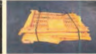
カゴ 切断し、重ねて結束※取っ手が金属の場合は取り除く