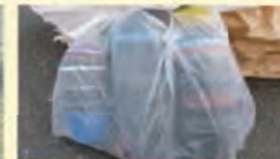
ポット 土を落とし重ねる