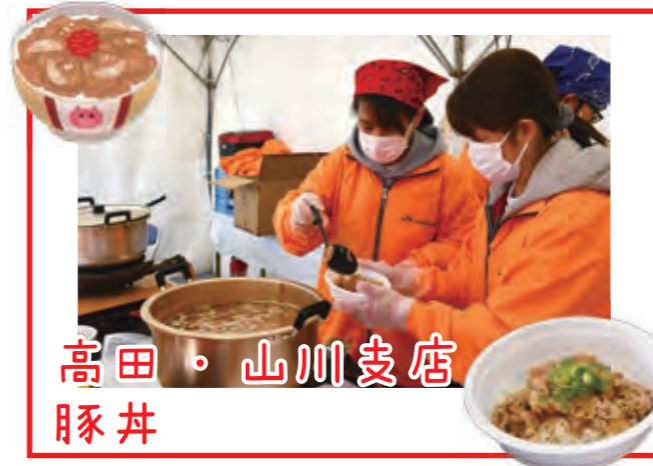
高田・山川支店 豚丼