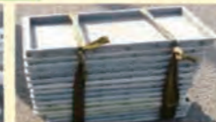
苗箱 20枚重ね、2ヶ所結束