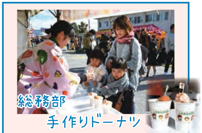
総務部 手作りドーナツ