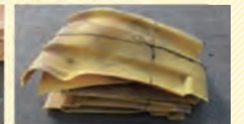
タンク 平らに切断し、重ねて結束