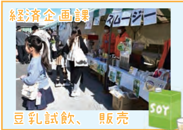
経済企画課 豆乳試飲、販売