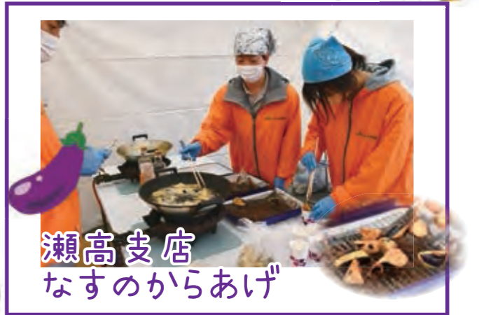
瀬高支店 なすのからあげ