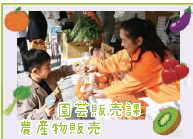
園芸販売課 農産物販売