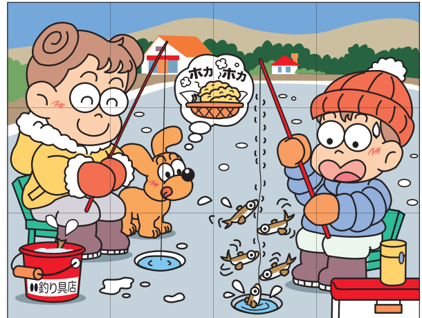
出題・イラスト:酒井栄子