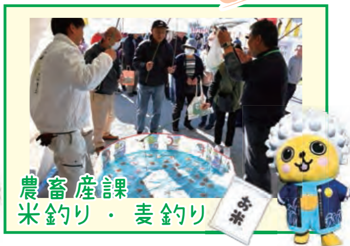
農畜産課 米釣り・麦釣り