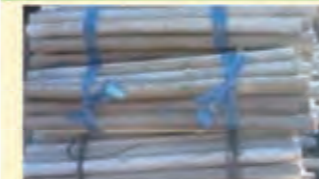
塩ビパイプ 1mに切断し、2ヶ所結束