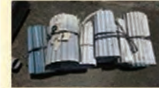
アセ波 ほどけないように結束