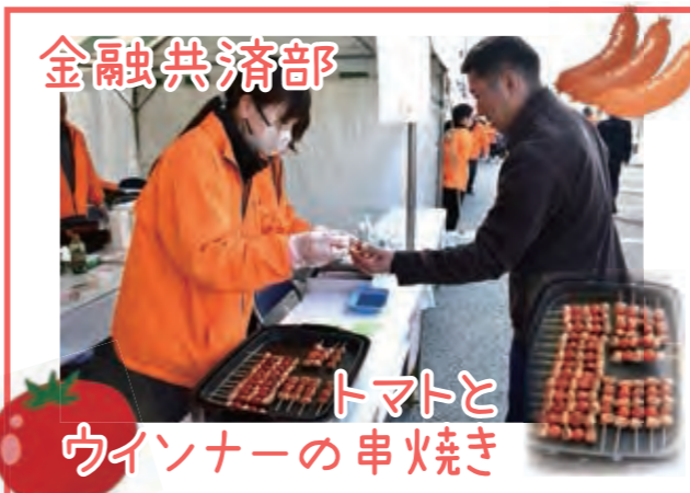
金融共済部 トマトとウインナーの串焼き